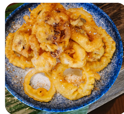
MỰC ỐNG CHIÊN GIÒN MUỐI RAU THƠM