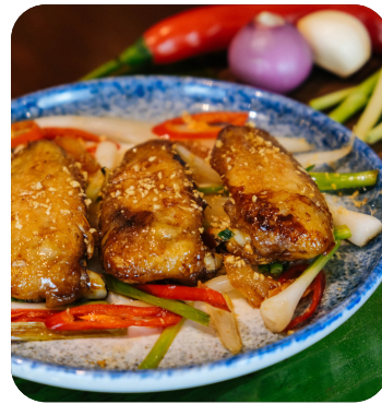
CÁNH GÀ CHIÊN NƯỚC MẮM Grilled chicken wing, fish sauce