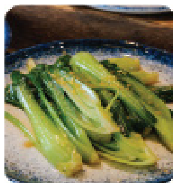
CÁI THÌA XÀO TỎI Sautéed bokchoy with garlic