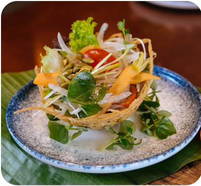
GỎI NHIỆT ĐỚI Mixed tropical salads, passion fruit dressing