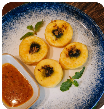
ĐẬU HỦ RAU CỦ CHIÊN CHAY Vegetarian fried tofu