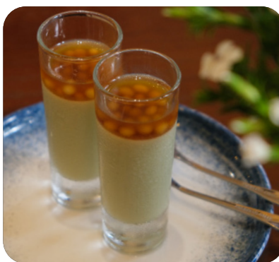
PANNA COTTA ĐẬU HŨ NƯỚC ĐƯỜNG TRÂN CHÂU