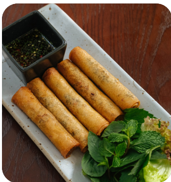
CHẢ GIÒ QUE Stick spring roll