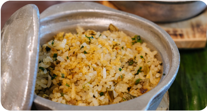
CƠM CHIÊN BÒ KHO Beef fried rice