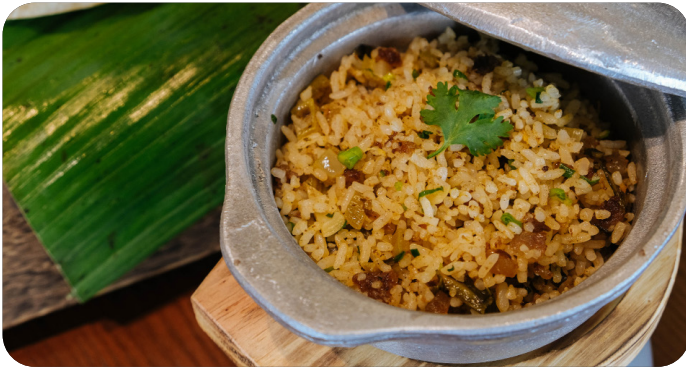
CƠM CHIÊN CÁ MẶN Fried rice with salted dried fish