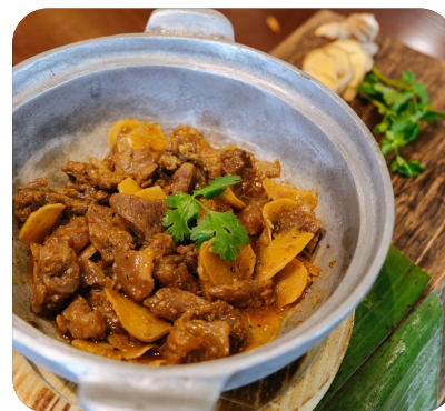
GÂN BÒ OM Braised beef tendon