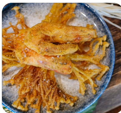
TÔM CHIÊN GIÒN XỐT MUỐI RAU THƠM