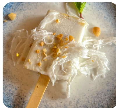
KEM CHUỐI Banana ice cream