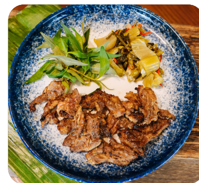
ĐÈ SƯỜN NƯỚNG Grilled beef rib