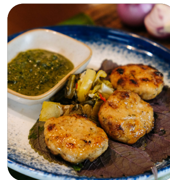
CHẢ HẸN NƯỚNG RAU RĂM Baby clams cake