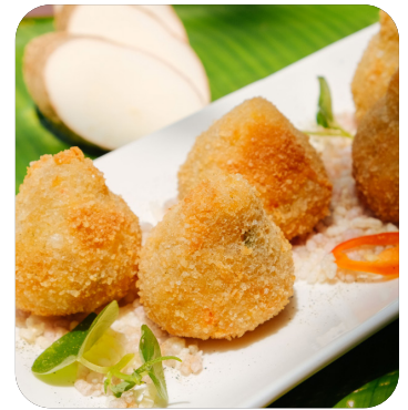
BÁNH KHOAI MÌ HẢI SẢN CHIÊN GIÒN Crispy seafood casava cake