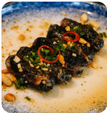
BÒ LÁ LỐT Grilled beef in betel leaf