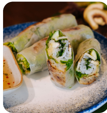
GÒI CUỐN CHẢ HẾN THÌ LÀ Baby clam cake rolls with dill