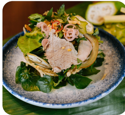
GỎI BÒ TƠ Beef salad