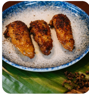
CÁNH GÀ NƯỚNG MẮC KHÉN Grilled chicken wing