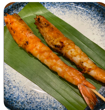
TÔM NƯỚNG Grilled shrimp