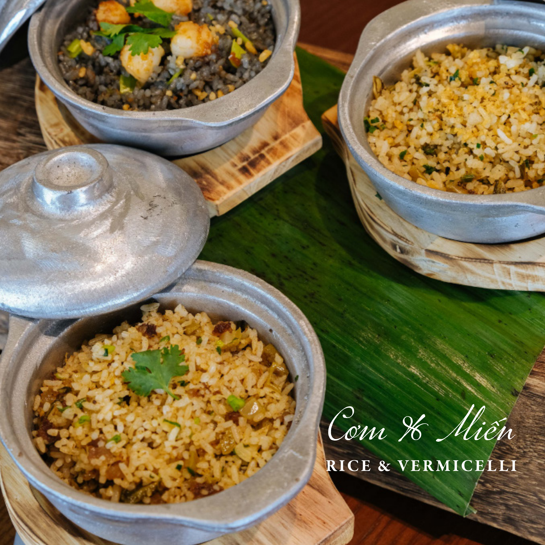
Com & Miến RICE & VERMICELLI