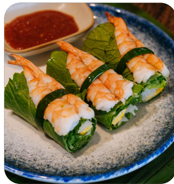
CUỐN DIẾP TÔM Vegetable rolls with fermented shrimp