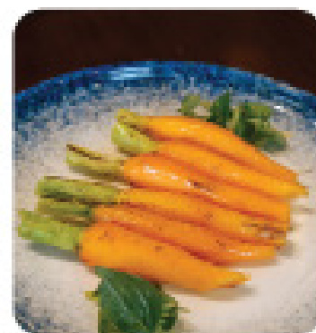
CÀ RỐT XÀO Sautéed carrot