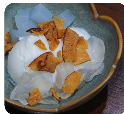
KEM DỪA Coconut ice cream