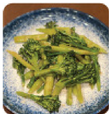
BÔNG CÁI XÀO TỎI Sautéed broccoli with garlic