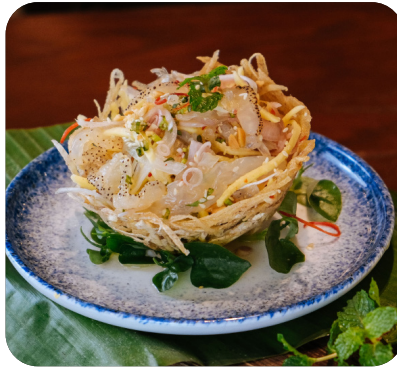
GỎI SỮA Jelly fish salad