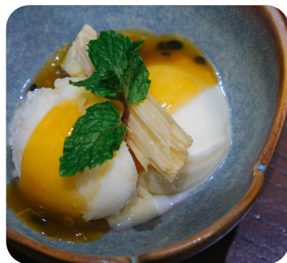
KEM CHANH DÂY Passion ice cream