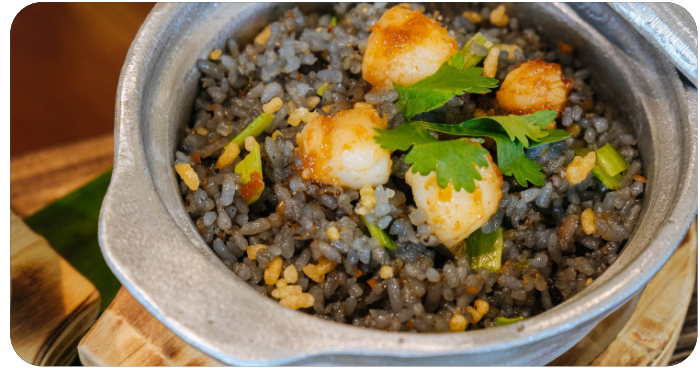
CƠM CHIÊN SÒ ĐIỆP Scallop fried rice