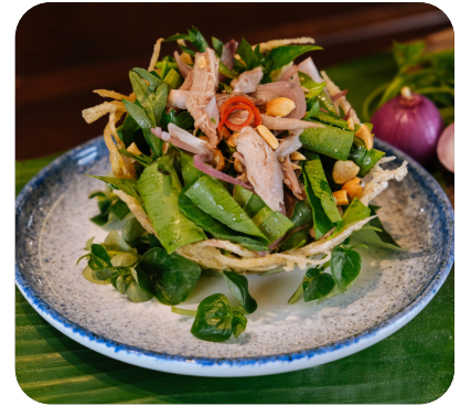
GỎI VỊT Duck salad