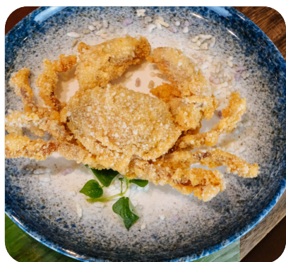
CUA LỘT CHIÊN GIÒN XỐT XÍ MUỘI