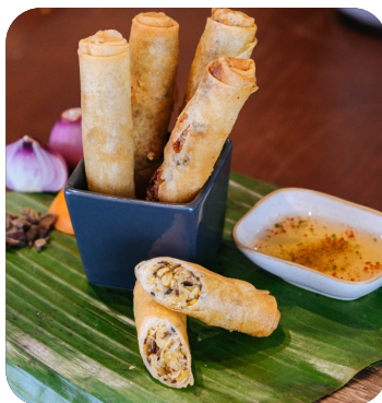
CHẢ GIÒ CHAY Vegetarian spring roll