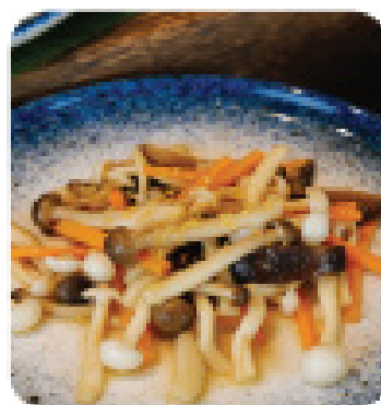
NẤM XÀO TỎI Sautéed mushroom with garlic