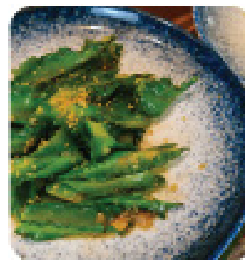
ĐẬU RỒNG XÀO TỎI Sautéed winged bean with garlic