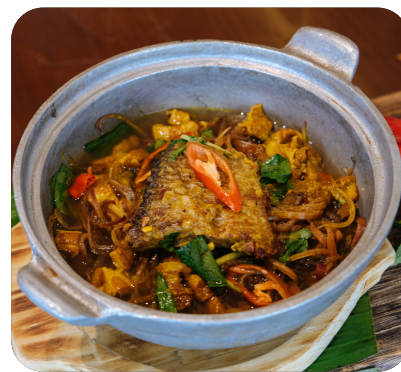
CÁ LÓC NẤU ÁM Snakehead cooked in "nấu âm"