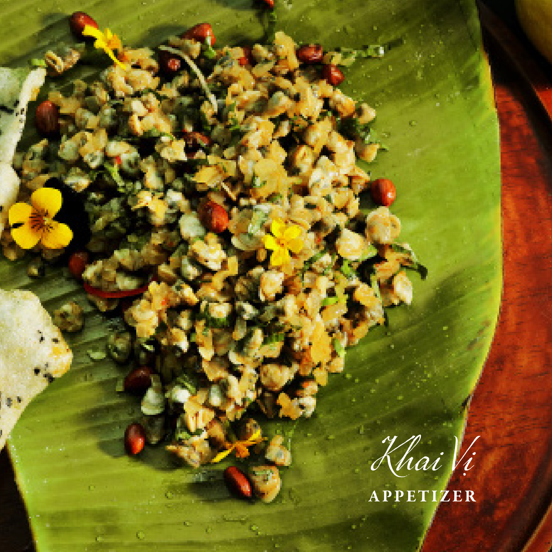
Khai Vei APPETIZER