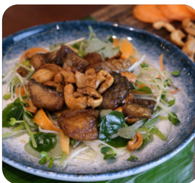
CÁ LÓC LÚC LẮC HẠT ĐIỀU Wok-fried snakehead, cashew nuts