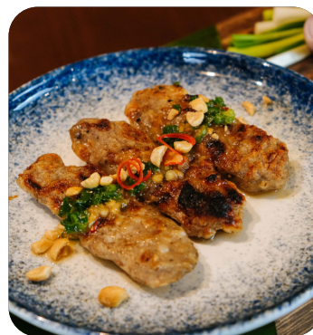
NEM NƯỚNG Vietnamese grilled pork sausage