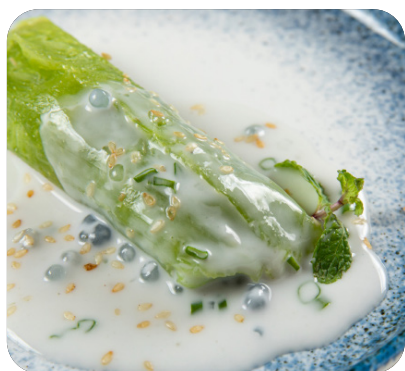
BÁNH KHOAI MÌ CỐT DỪA