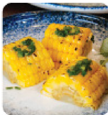
BẮP NƯỚNG Grilled corn