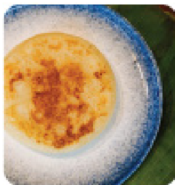
BÁNH KHOAI MÌ Cassava cake