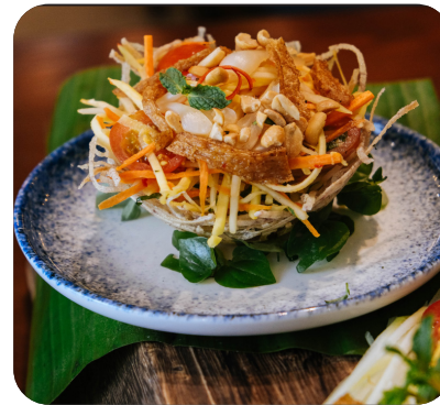
GỎI ĐU ĐỦ Papaya salad