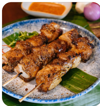
GÀ XIÊN NƯỚNG Grilled chicken skewer