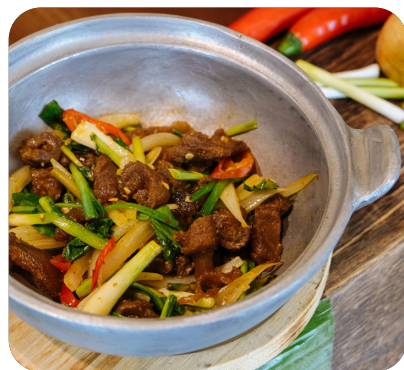
GÂN BÒ XÀO LĂN Sautéed beef tendon