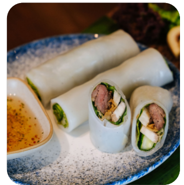
BÁNH PHỞ CUỘN BÒ Pho rolls with beef