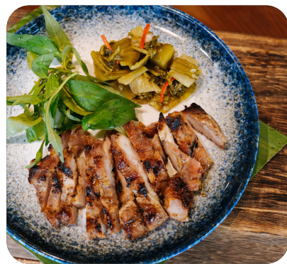
THĂN HEO NƯỚNG Grilled pork tenderloin