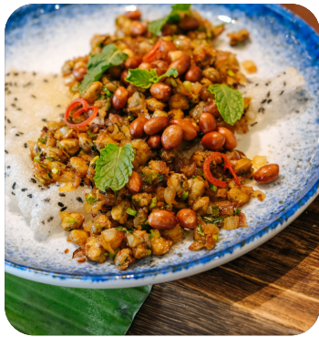
HẾN XÀO XÚC BÁNH ĐA Stir-fried baby clams