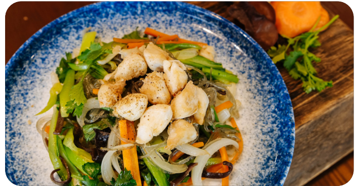
MIẾN XÀO CUA Stir-fried vermicelli, crab meat